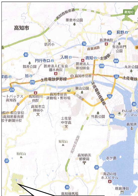
高知県立春野総合運動公園